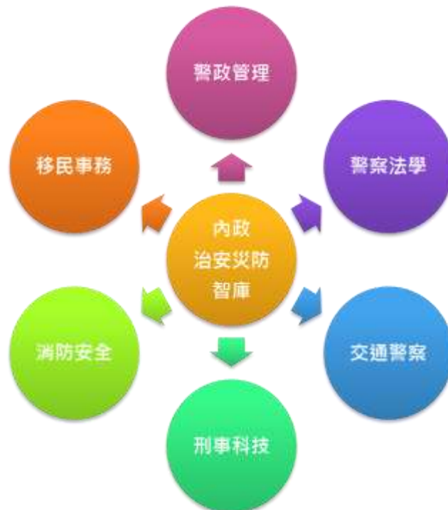
內政治安、災防智庫領域圖